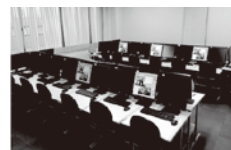
マルチメディア教室