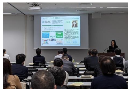
企業向けセミナー