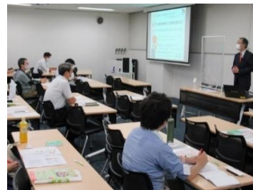
企業向けセミナー