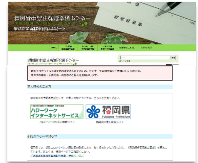
中高年就職支援センターHP