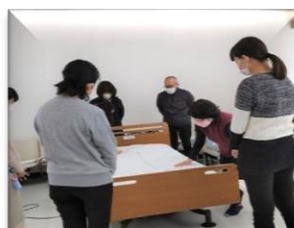
介護職員初任者研修