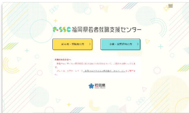
若者就職支援センターホームページ