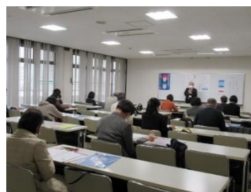
就業支援セミナー