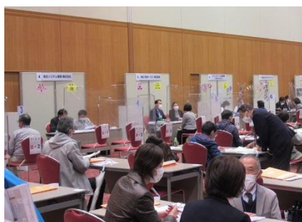
アクティブシニアしごと合同説明会