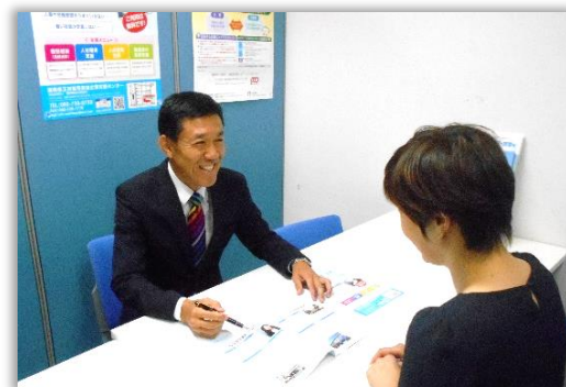
センターでの個別相談