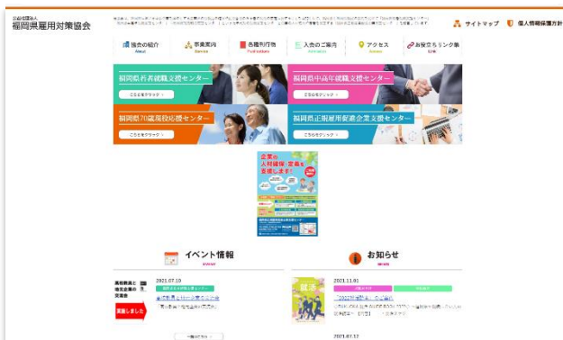
福岡県雇用対策協会

「福岡県雇用対策協会」「若者就職支援センター」「正規雇用促進企業支援センター」のホームページの管理・運営を行った。