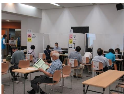
しごと・ボランティア合同説明会