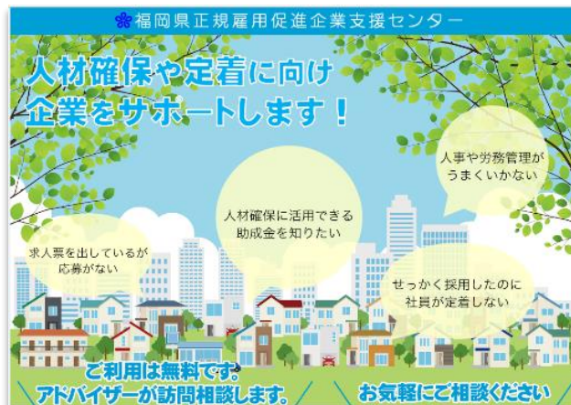
正規雇用促進企業支援センターホームページ