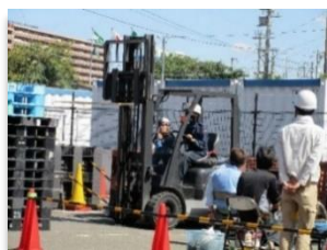
フォークリフト運転技能講座